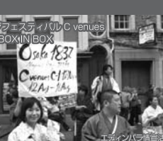
エディンバラ公演風景

常未目前の天保8年の大阪の染物屋を舞台に繰り広げられる情と恋の物語。開演前のおもてなしでは3都市ともお客様に同席を配りこれを持って頂いた。2008年度池袋演劇祭・としまテレビ賞受賞